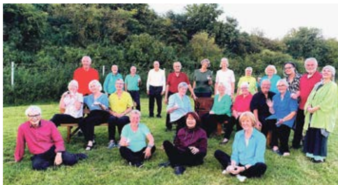
Der gemischte Chor „Heiterkeit“ aus Scharmbeck gastiert in diesem Jahr auch im Ashäuser Hof. Das genaue Datum steht noch nicht fest.

Der Chorleiter im Film hat ganz bewusst nicht nur Menschen mit