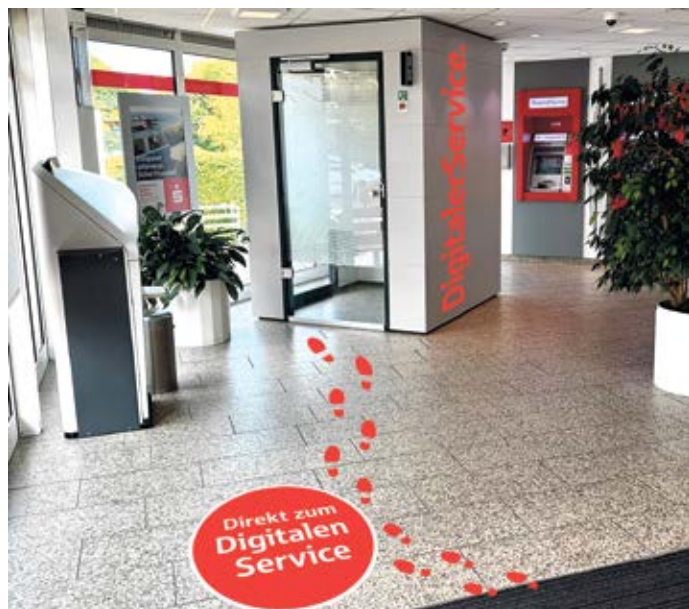
Der neue Videoservice-Raum im Foyer der Sparkasse Harburg-Buxtehude.