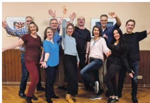
Mit Leidenschaft dabei: der Tanzkurs Latein.

(nn./in.). Stelle. Die Tanzsportabteilung (TSA) des TSV Stelle feierte ihren Jahresauftakt mit ihren Mitgliedern mit Tanz und Buffet im Saal auf der kurzen Heide. Frisch gestärkt geht es ins neue Jahr, in dem so einiges ansteht: Im Januar läuft bereits ein Discofoxworkshop- weitere Workshops werden folgen, geplant sind dieses Jahr: Discofox Beginner- und Aufbaukurs, Lindance und Erlebnistanz (Tanzen ohne festen Partner). Die Workshops werden samstags stattfinden, genaue Termin folgen. Herzlich willkommen sind auch weiterhin neue Tanzpaare in den Tanzkreisen: Dienstags: Schwerpunkt lateini-