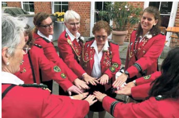
Mit Witz, Charme und natürlich farblich passenden Fingernägeln: Frauenpower in Rot.

Pause vom „Partystress“. Wenn ab 15 Uhr kleine Piraten, Prinzessinnen oder Kätzchen im Schützenvolk zu entdecken sind, dann hatten die kleinen Gäste Spaß beim Kinderschminken. Ein Luftballonkünstler lässt ebenfalls die Augen der kleinen Gäste leuchten. Bis 16.30 Uhr finden verschiedene Schießwettbewerbe