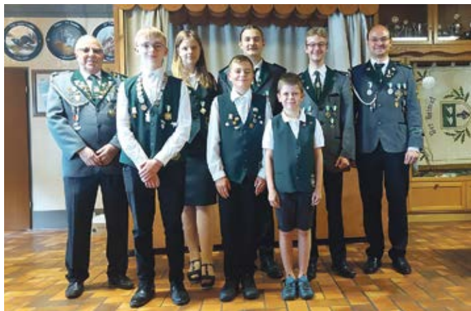
Die Jugendkönige strahlen mit den „Großen“ um die Wette.

statt. Spannend wird es gegen 16.30 Uhr. Wer wird neuer Dorfkönig und Kinderkönig? Am Sonntag, den 6. August steigt gegen 13.15 Uhr der große Festmarsch in Begleitung der Feuerwehr. Die Kinder sammeln sich um 14 Uhr am Bach/Brink. Gegen 15 Uhr feiern die Kids ihr Kinderschützenfest mit tollen Spielen.