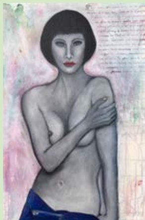
„Der Akt“ als künstlerische Gestaltungsform.

(nn./in.). Stelle. In der Bücherei Stelle findet ab sofort wieder eine Ausstellung des KunstWerk Stelle e.V. statt.