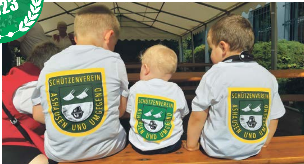
Der Nachwuchs steht schon in den Startlöchern.

(in). Ashausen. Wenn die Ashausener Schützen feiern, dann richtig! Ein buntes Programm sorgt für Stimmung pur. Los geht es am Freitag, den 4. August. Ab 15.30 Uhr ist der Festplatz für