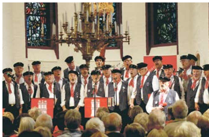
Bekannt aus dem Fernsehen: De Tampentrekker.

(in). Stelle. Sie sind bekannt aus „Inas Nacht“ und sorgen für musikalischen Spaß pur: De Tampen-