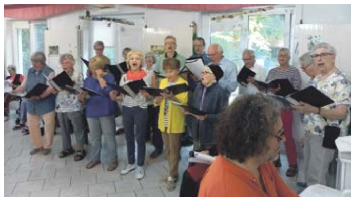
Der Steller Chor e.V.

lich in die fröhliche Welt des Steller Chores hineinzuschmecken, ist herzlich eingeladen. Die Pro-