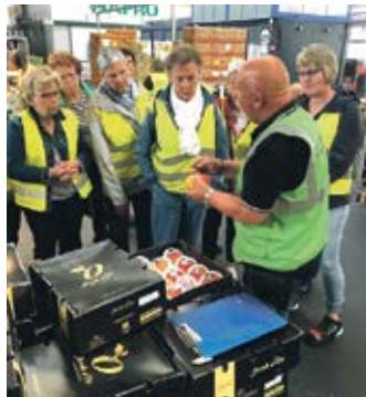
Die LandFrauen bei einem Besuch auf dem Hamburger Großmarkt.