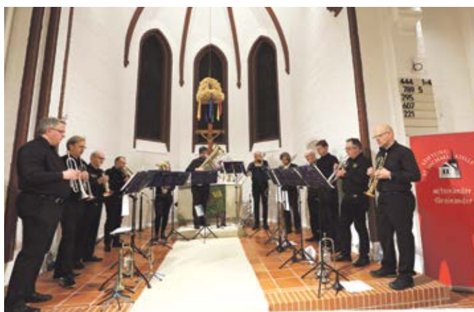
(in). Stelle. Das beliebte Bläserensemble „Windstärke 11“ gastiert am Samstag, den 25. März um 17 Uhr in der St. Michael Kirche in Stelle. Der Eintritt beträgt zehn Euro und kommt der Stiftung St. Michael zugute.