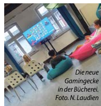
Die neue Gamingecke in der Bücherei.

Die Vorstellung, dass sich Büchereien ausschließlich um Bücher kümmern und fürs Lesen zuständig sind, ist sehr antiquarisch. Kinder verbringen viel Zeit vor dem Bildschirm. Umso wichtiger ist es zum einen, die Spielauswahl pädagogisch zu begleiten und zum anderen, die Kinder vor Ort zusammenzubringen. Beim Medienkonsum der Kinder und Jugendlichen zwischen acht und