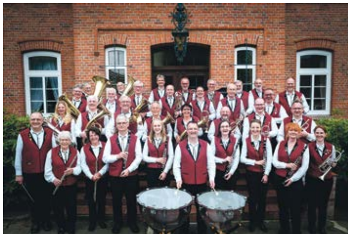
Seit drei Jahrzehnten ein Garant für tolle Stimmung: Die Steller Musikanten.