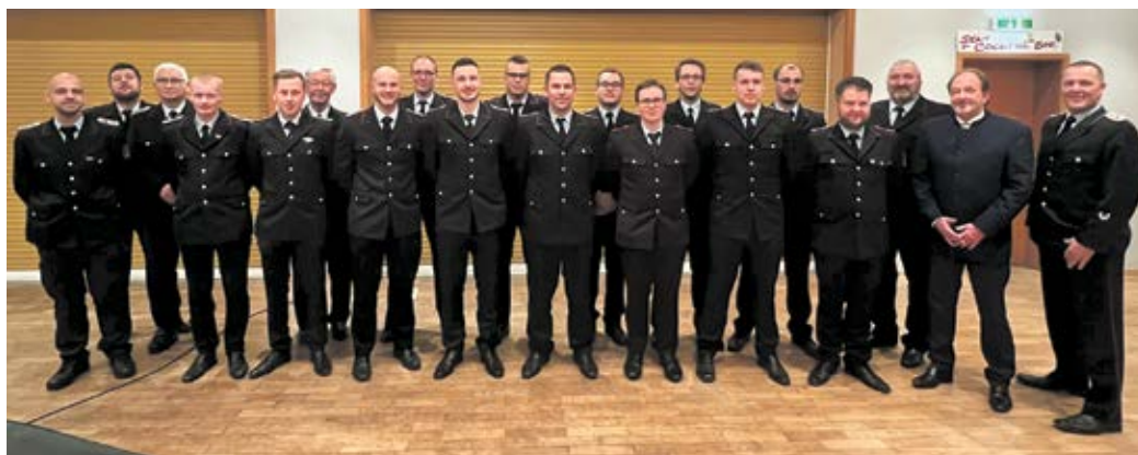
Jahreshauptversammlung der Freiwilligen Feuerwehr Stelle.

(in). Stelle. Bei der Jahreshauptversammlung der Freiwilligen Feuerwehr Stelle wurde auf ein ereignisreiches Jahr 2022 zurückgeblickt. So musste die Feuerwehr 104 Einsätze absolvieren, das Kreiszeitlager der Gemeinde sowie das Osterfeuer organisieren. Auf der gut besuchten Versammlung